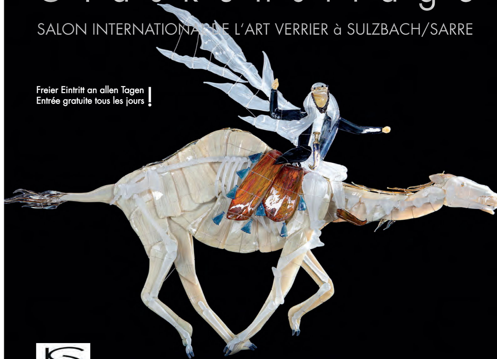
Layout & Grafik Dagmar Günther, Sulzbach. Titel: Objekt von Herrmann Ritterswürden

Freier Eintritt an allen Tagen! Entrée gratuite tous les jours!